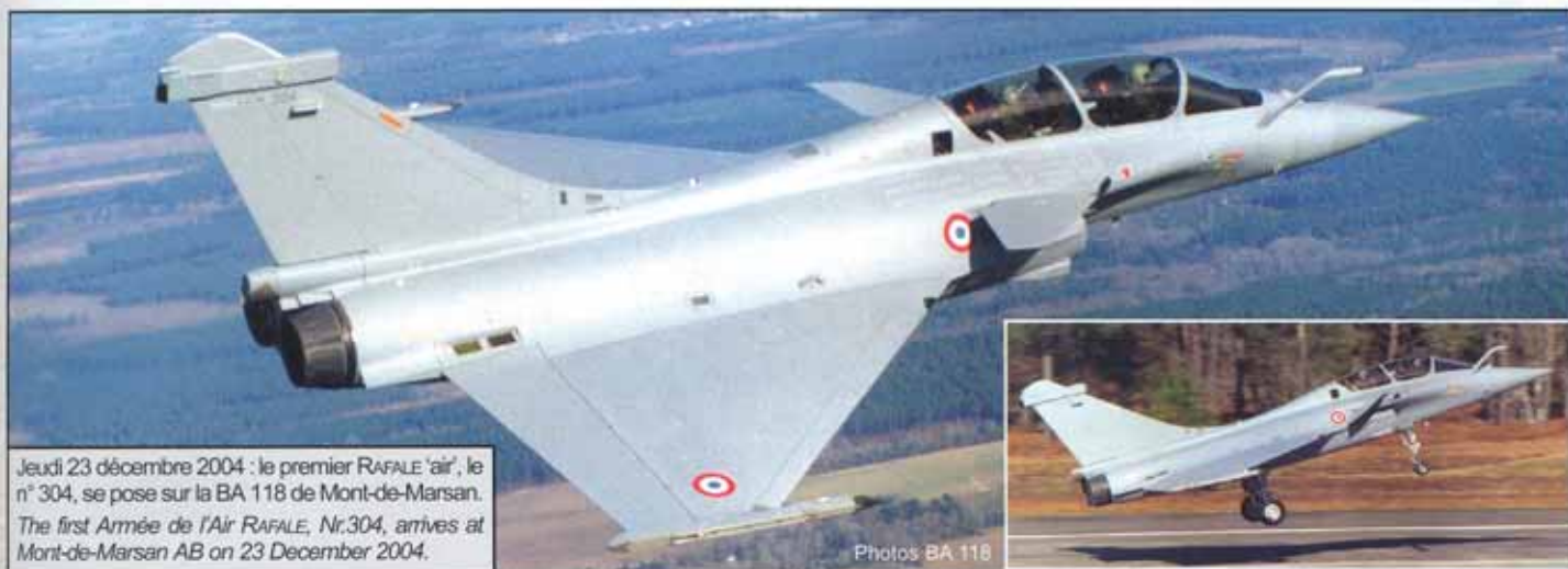
Jeudi 23 décembre 2004 : le premier RAFALE 'air', le n° 304, se pose sur la BA 118 de Mont-de-Marsan. The first Armée de l'Air RAFALE, Nr.304, arrives at Mont-de-Marsan AB on 23 December 2004.